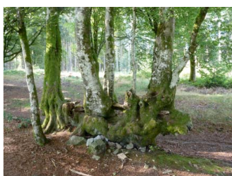
La souche d'une queue, hêtre tressé à la manière des Gaulois