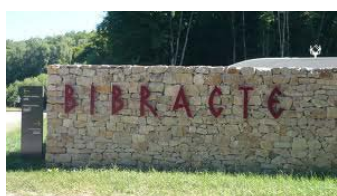
L'entrée du site

Le mont Beuvray n'est pas le mont Saint-Michel et ne souffre pas de la surfréquentation habituelle aux grands sites touristiques. Si l'on compte près de 80 000 visiteurs sur le mont Beuvray chaque année, le site est vaste, couvrant près de 1 000 ha, et les touristes se concentrent essentiellement sur les chantiers de fouilles et sur le belvédère. Pour qui veut entendre souffler l'esprit des lieux, il est donc facile de s'éloigner un peu sous les grands arbres... Le mont Beuvray, c'est d'abord une forêt : selon les saisons, les atmosphères et les couleurs sont différentes et sauront répondre à la sensibilité de chacun. Notez enfin que le climat est particulièrement humide et la région est parfois fortement enneigée en hiver.