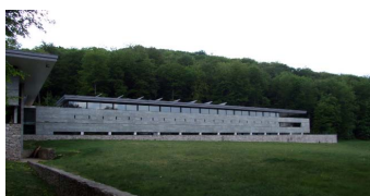
Le musée de la Civilisation celtique