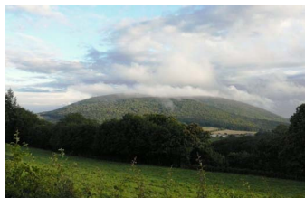
La vue depuis le mont Beuvray