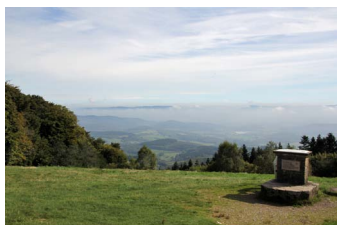
Bibracte - La vue du belvédère