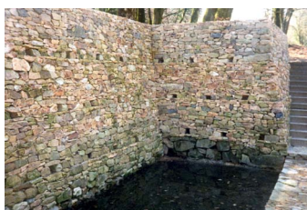
La fontaine Saint-Pierre

C'est Jacques-Gabriel Bulliot, érudit de la Société éduenne d'Autun qui a redécouvert le site de l'antique Bibracte au milieu du XIX e siècle et en a supervisé les fouilles pendant trente ans. Puis c'est sous l'impulsion de François Mitterrand que les premières fouilles archéologiques du XX e siècle sont lancées en 1984. Les 135 ha de la ville antique sont classés « Monument historique » en 1984. Le site est proclamé grand site national en 1985 et inscrit sur la liste des Grands Travaux en 1989. L'ancienne cité de Bibracte fait depuis l'objet de fouilles permanentes.