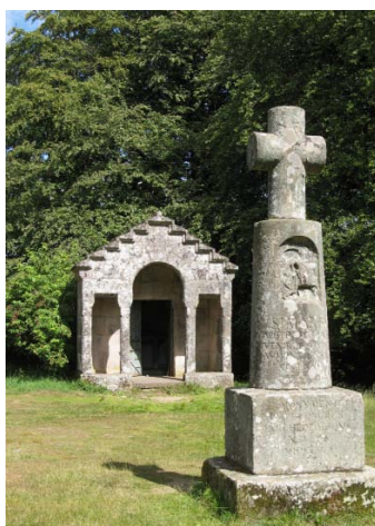
Mont Beuvray, la chapelle Saint Martin

La vie ne s'est pourtant pas totalement retirée du mont Beuvray. Deux lieux, à la chapelle Saint-Martin et à la fontaine Saint-Pierre, restent actifs durant toute l'Antiquité. Puis au cours du Moyen-Age, une grange monastique dépendante d'une abbaye d'Autun est fondée et sera occupée du XV e au XVII e siècle par un couvent de franciscains. Du XIII e au XIX e siècle, une grande foire annuelle perpétue la tradition commerciale et économique de l'ancienne cité. Au XIX e siècle, le sommet est occupé par des prairies où viennent paître les troupeaux à la belle saison. Les vestiges de haies plessées (appelées queules ou pians) témoignent encore de ce passé pastoral et participent au pittoresque d'aujourd'hui. Depuis la seconde moitié du XX e siècle, conséquence de la déprise agricole, la forêt reconquit l'ensemble du massif. L'établissement public de Bibracte, propriétaire du site, entreprend de rétablir les chaumes de jadis et de limiter l'enrésinement de la forêt.