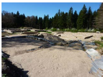
Fouilles du mont Beuvray, ruines d'un habitat éduen

Le parking du musée constitue également un lieu de départ idéal pour arpenter sentes et chemins à la découverte du mont Beuvray.