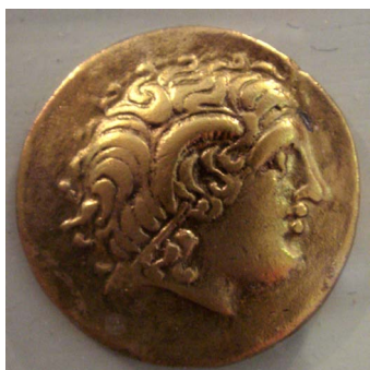
Monnaie séquane (V e - I er siècle av. J.-C.)

Chaque année, en octobre, le village de Saint-Léger-sous-Beuvray organise une importante foire aux châtaignes.