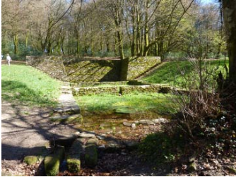
Bassin et fontaine