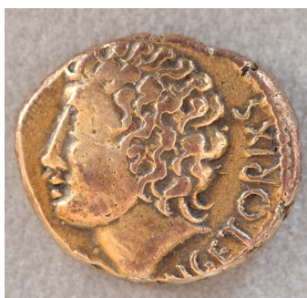
Statère à l'effigie de Vercingétorix

La ville s'étalait alors au sommet de la montagne, l'agriculture occupait les versants, la forêt se cantonnant aux pentes les plus fortes. C'était une importante place commerciale et un centre industriel actif où se concentraient de très nombreux ateliers de bronziers, forgerons et orfèvres. Sur le site cohabitaient la cité gauloise, dont il reste peu de traces (habitat essentiellement en bois) et une ville romaine avec ses bâtiments publics,