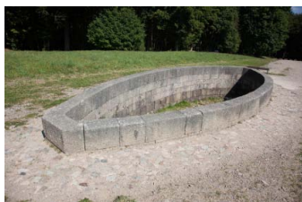
Bibracte, le bassin